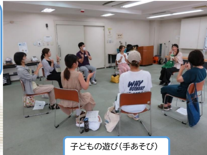
子どもの遊び(手あそび)

全講座修了(9項目24時間) お疲れさまでした♪ これからもサポートでお世話になります。